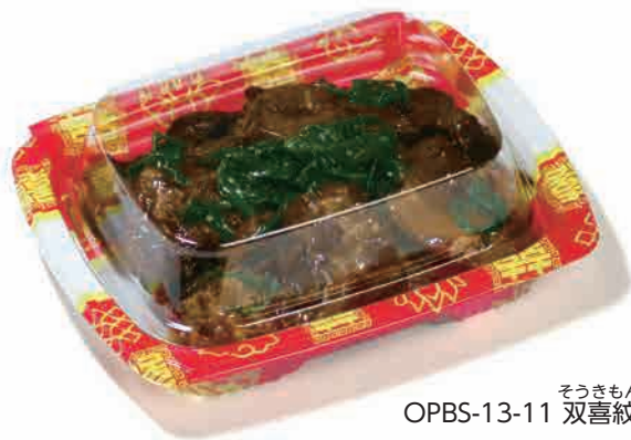
OPBS-13-11 そうきもん 双喜紋