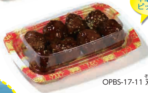
OPBS-17-11 双喜紋 そうきもん