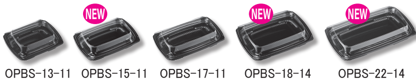
OPBS-13-11 OPBS-15-11 OPBS-17-11 OPBS-18-14 OPBS-22-14