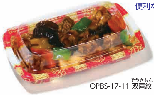
OPBS-17-11 双喜紋 そうきもん