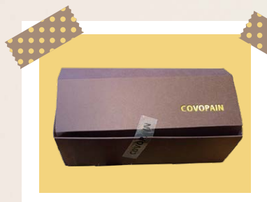
例1.箔押し印刷された化粧箱

既製品の箱に金属板の凸版を使用し熱と圧力をかけて、色箔を紙へ圧着させる加工です。