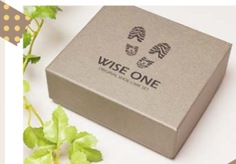
例2.ワンポイントが入った化粧箱